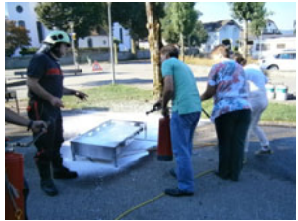
Der richtige Einsatz des Feuerlöschers muss auch von den Lehrpersonen beherrscht werden.