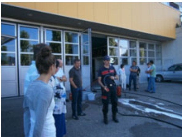
Kompetente Ausführungen des Feuerwehrkommandanten