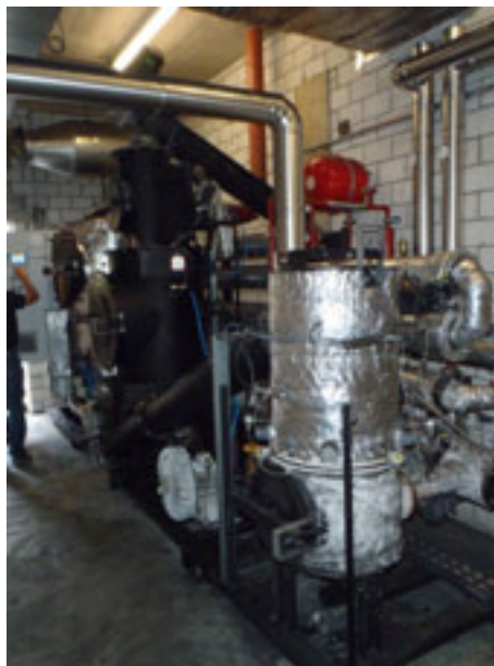
Holzvergasung Steiner Sägerei

Wir freuen uns auf zahlreiche interessierte Mitbürgerinnen und Mitbürger.