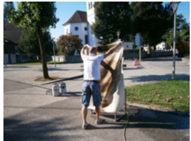
Einfaches, aber effektives Hilfsmittel: Das Brandtuch

Das richtige Verhalten bei Notfällen wird in diesem Schuljahr auch mit den Schülern geübt und soll einen fixen Platz im Jahresprogramm der Schule bekommen.