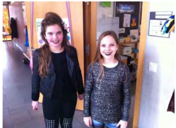
Zuerst Schminken dann Ablichten: Schicke junge Damen...