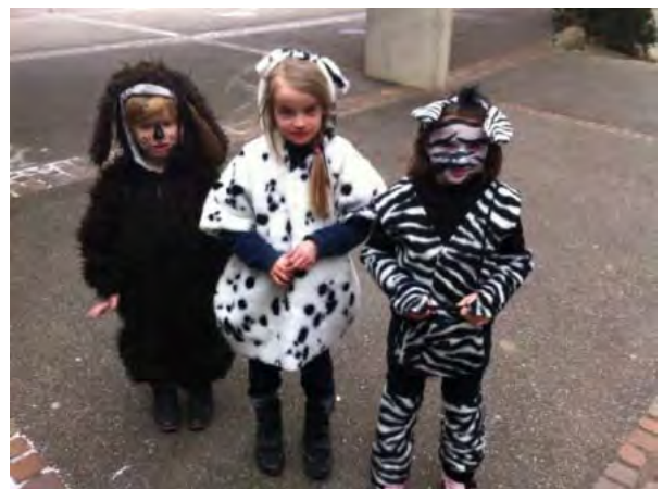
...und wilde Tiere