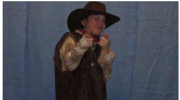
...und coole Cowboys