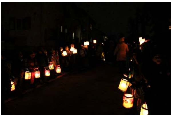
Spalierstehen für den Samichlaus

Herzlichen Dank an die Samichlaus- gruppe, die engagierten Kinder, Lehr- personen und Eltern und an die Fotografin Cornelia Schmid!