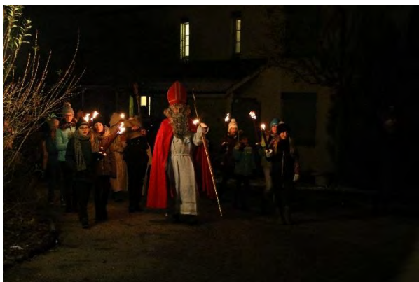
In zahlreicher Begleitung!