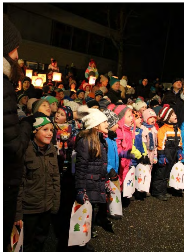
Voller Inbrunst werden Lieder und Ge- dichte vorgetragen.