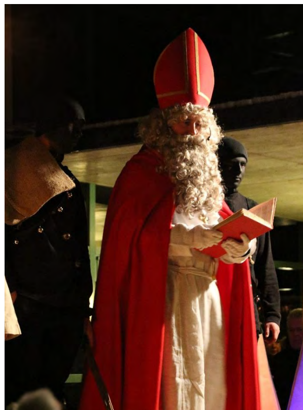
Der Samichlaus wird es uns sagen. Wer weiss es auch jetzt noch?

Herzlichen Dank an die Samichlaus- gruppe, die engagierten Kinder, Lehr- personen und Eltern und an die Fotografin Cornelia Schmid!