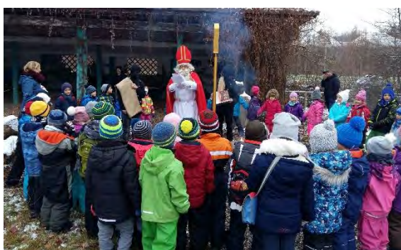
Der Samichlaus begrüßte uns alle.

Am letzten Montag, 4. Dezember 2017 kamen alle Kindergartenkinder warm eingepackt in den Kindergarten. Grund: Wir marschierten ins Naturlehrgebiet. Überraschung: Dort erwartete uns der Samichlaus mit seinen Schmutzlis.