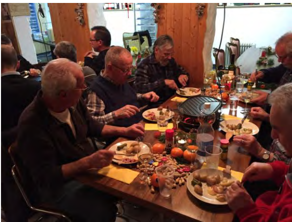
Raclette eifach guet...

Danke an alle die geholfen haben, diesen Anlass zu organisieren!