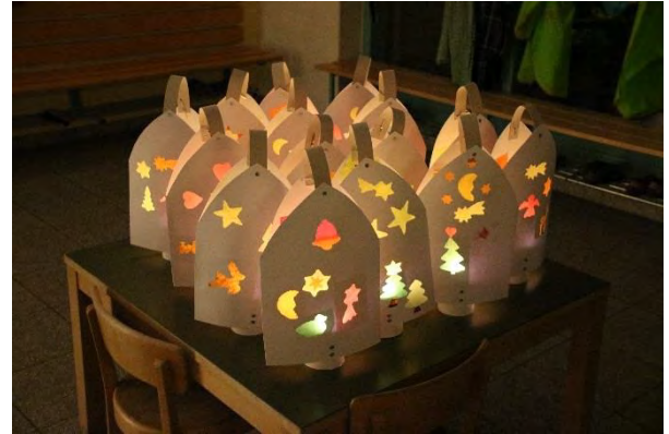
Kleine Infuln der KindergärtlerInnen

Am Ende erhielt jedes Kind einen Lebkuchen und eine Mandarine. Während sich die Kinder bei einer Ovi und die Erwachsenen bei einem Tee aufwärmen konnten, trat noch einmal die Bläsergruppe auf. Ihre Musik rundete den Chlauseinzug feierlich ab und liess vorweihnächtliche Stimmung aufkommen.