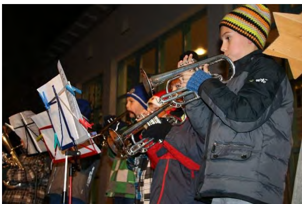
Musikalische Einstimmung auf die restli- che Adventszeit