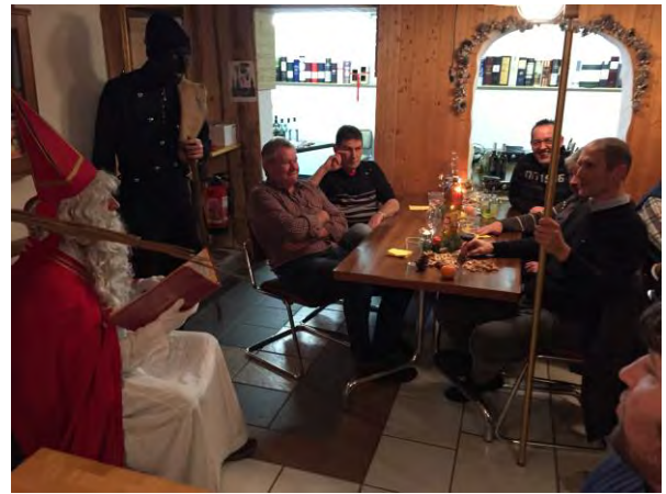
Doch so einiges hatte der Samichlaus in seinem dicken Buch notiert...