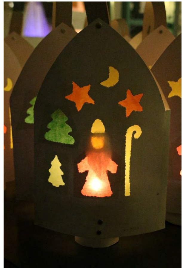
Hier war Feinarbeit angesagt. Der Arbeitseinsatz hat sich gelohnt!