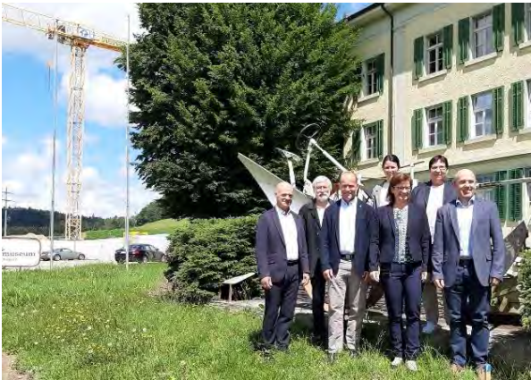
Vorstand Museumsverein mit Museumsleiterin und wissenschaftlicher Mitarbeiterin

Burgrain - Unübersehbar ist die Baustelle an der Kantonsstrasse beim heutigen Agrarmuseum im Burgrain. Erstellt wird dort ein markanter Holzbau für das neue Logistikzentrum der RegioFair (Verteil- und Lagerzentrum für bäuerliche Bioprodukte). Im Obergeschoss wird die neukonzipierte Dauerausstellung des Agrarmuseums eingerichtet. An der kürzlichen GV des Museumsvereins wurde detailliert informiert.