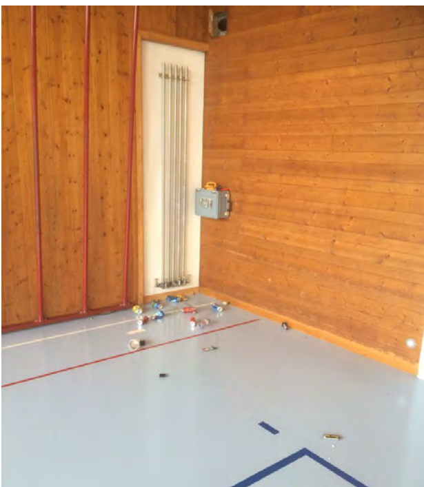
Durch die Öffnung oben wurden Knallkörper und Abfall in die Turnhalle geworfen.

Zeugen, die zum Vorkommnis sachdienliche Hinweise abgeben können melden sich telefonisch (041 984 13 20) oder via E-Mail ( gemeindeverwaltung@ettiswil.ch ).