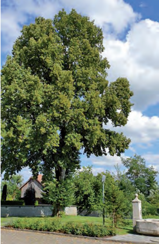
Linde bei der Kirche

Grosse Bäume sind schön anzuschauen und wertvoll für die Natur. Sie standen schon lange vor unserer Zeit an ihrem Ort und tragen viele Geschichten in sich. Die Gemeinde Ettiswil ist bestrebt, diese ehrwürdigen Wesen zu erhalten, denn grosse Bäume brauchen langfristigen Schutz.