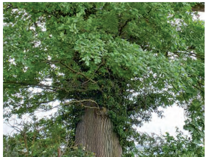
Eiche in Hecke nahe Kigro

Die Eiche kann sehr alt und mächtig werden. Auf alten Eichen leben unzählige Tierarten. Die dickste Eiche der Schweiz hat rund 9 m Umfang, die älteste dürfte etwa den Jahrgang 1350 haben, zur Zeit also, als Europa von verheerenden Pestzügen heimgesucht wurde.