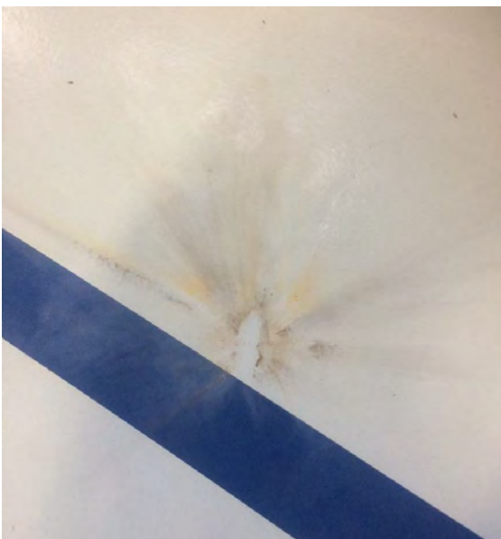
Brandbeschädigung am Boden