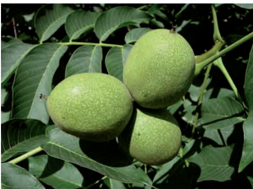
unreife Baumnüsse (Wikipedia)

Der Nussbaum kommt bei uns primär auf Hofplätzen vor. Der Baum bietet Schatten, Nüsse und wertvolles Holz. Leider sind in den letzten Jahren viele Nussbäume in Ettiswil verschwunden.