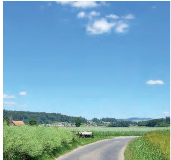
gleicher Ort mit wegretuschiertem Baum