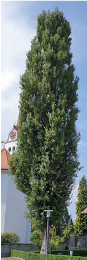
Pyramidenpappel bei der Kirche

schnell, aber schon nach wenigen Jahrzehnten fallen bei Sturm Äste ab, sodass die Art für den Siedlungsraum nur bedingt geeignet ist.