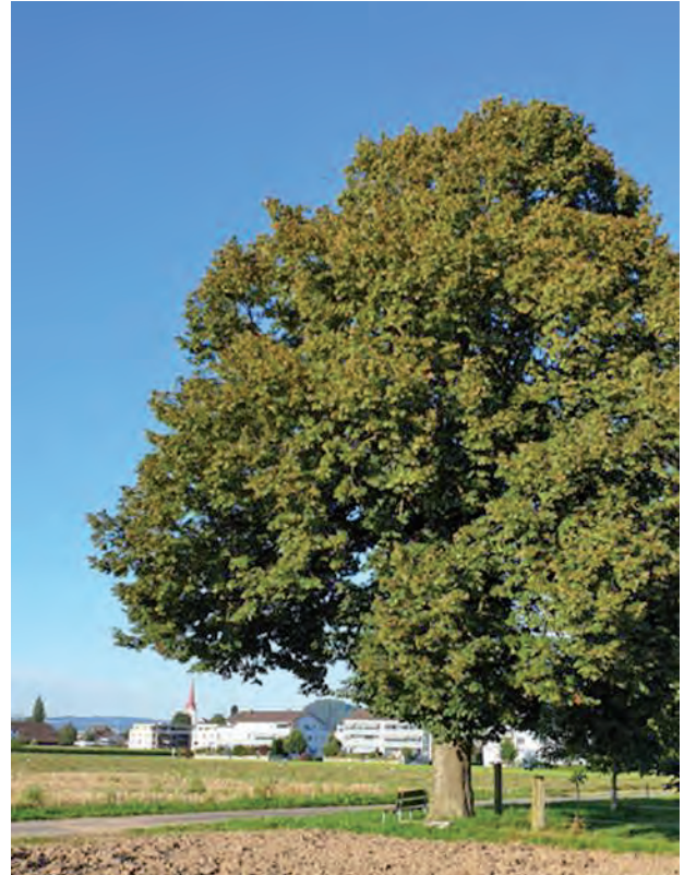
Linde an der Lindenstrasse

Liedern besuchen, unter ihr wurde Gericht gehalten und sie prägt mancherorts den Dorfplatz oder eine exponierte Stelle im Gelände. Markante Linden bei uns befinden sich beispielsweise bei der Schloss Wyher Kapelle, vor der Kirche und vor der Burg Kastelen.