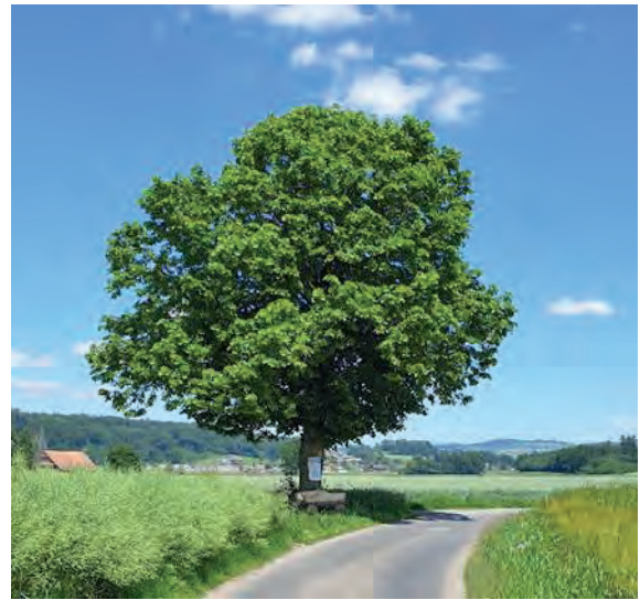
Linde nahe Seewagen

Grosse Bäume beherbergen eine grosse Biodiversität. Zahlreiche Arten von Vögeln, kleinen Säugetieren (darunter Fledermäuse), Insekten und viele mehr profitieren von Bäumen, insbesondere wenn diese Höhlen, furchige Rinde und Totholzäste aufweisen.