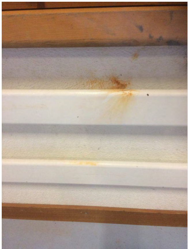
Brandbeschädigung an der Wand