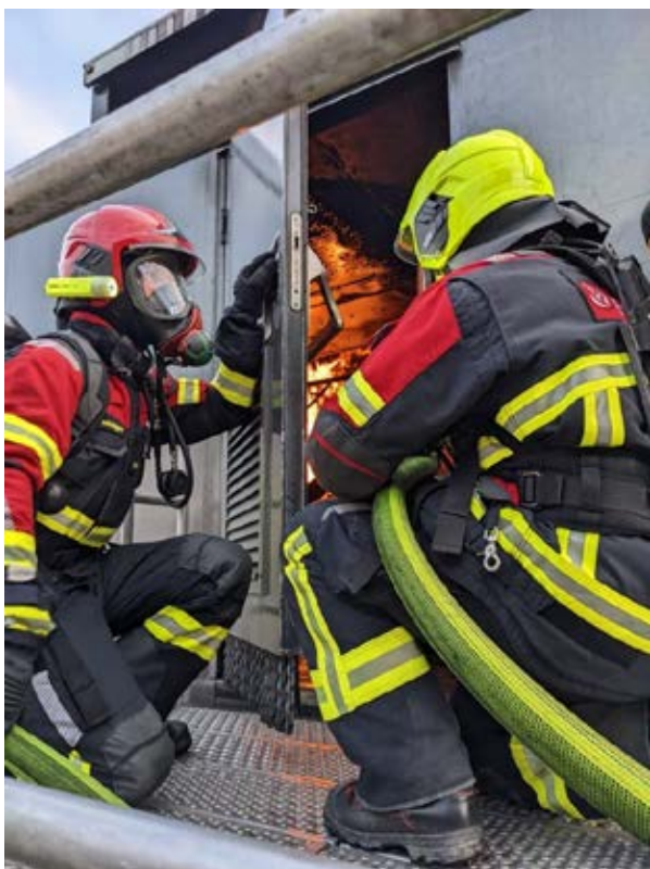
Einsatz bei der MBA

Was es sonst noch alles rund um die Feuerwehr zu sehen gibt, erfahren Sie unter: https://www.gvl.ch/unternehmen/luga/