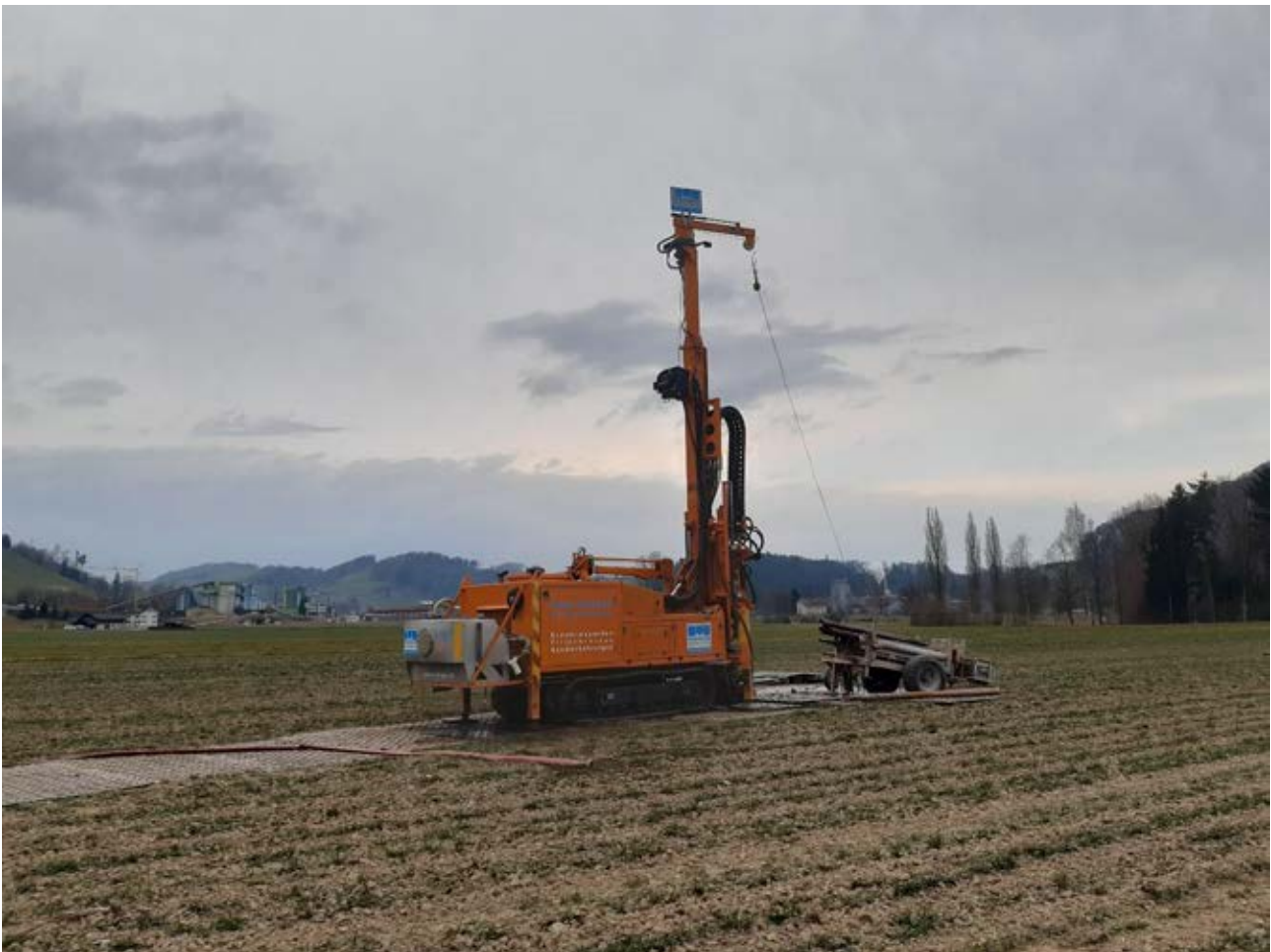
Testbohrung am geplanten Standort des zukünftigen Grundwasserpumpwerks

Anschliessend wird die Burgrain Wasser AG ein entsprechendes Konzessionsgesuch beim Kanton Luzern einreichen und es finden die Ausscheidung der Schutzzonen statt. Bis jedoch Wasser aus dem Gebiet Burgrain in die Haushalte der beteiligten Gemeinden fliesst, wird es noch einige Zeit dauern.