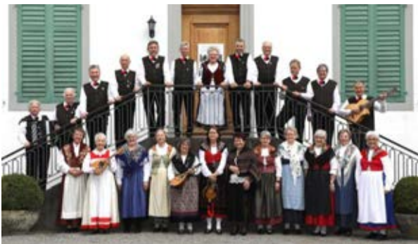
Corale pro Ticino Lucerna

Zu diesem Heim haben die Organisatoren des Konzertes eine direkte Verbindung, was die Investition der Kollekte in das Heim garantiert.