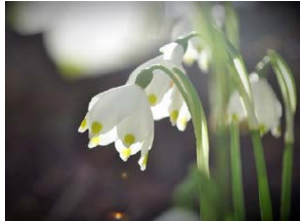
Tolles Fotosujet: Der Märzenbecher.

Der Tagesgrundkurs zu Fotografieren in der Natur am 29. April 2023 war sehr schnell ausgebucht, Anmeldungen können leider keine mehr entgegengenommen werden.