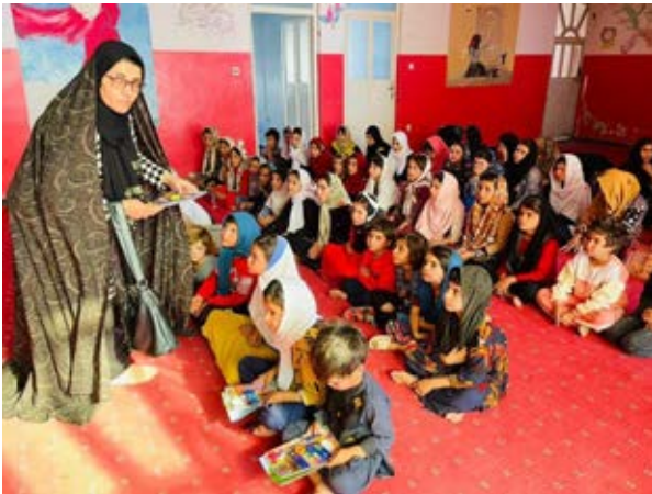
Die Kinder in Herat erhalten Schulmaterial

Am Sonntag, 30. April 2023 findet um 11.00 Uhr in der Kirche Ettiswil ein Benefizkonzert statt. Das OK organisiert mit Musik-Formationen aus Ettiswil und dem Kanton Luzern ein Konzert mit Kollekte für den Zweck «Ettiswil für Afghanistan». Dabei geht es um die Unterstützung eines Waisenheimes in Herat/Afghanistan.