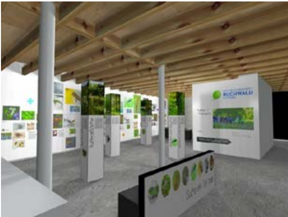
Geplante Ausstellung im Neubau (hof3).

Ausstellung: Damit die Ausstellung auch an Wochenenden besucht werden kann, suchen wir Unterstützung. Für Interessierte findet am 5. April und 1. Mai 2023 jeweils um 19:00 Uhr im neuen Naturzentrum eine Infoveranstaltung statt (Dauer bis ca. 20:30 Uhr). Anmeldung ab sofort möglich, siehe Infokasten unten.