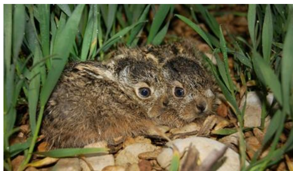
Zwei wenige Tage alte Junghasen schmiegen sich im Weizenfeld an den Boden, um nicht entdeckt zu werden.

Mit Inkrafttreten der neuen Kantonalen Jagdgesetzgebung per 1. April 2018 gelten Widerhandlungen gegen die Leinenpflicht als Ordnungsbusse und können mit 100 Franken sanktioniert werden.