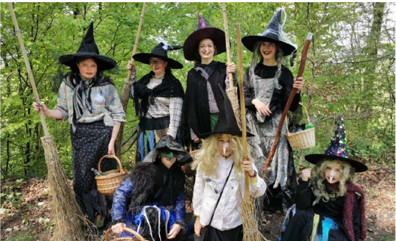
Die jungen Alberswiler Hexen an der letzten Walpurgisnacht.